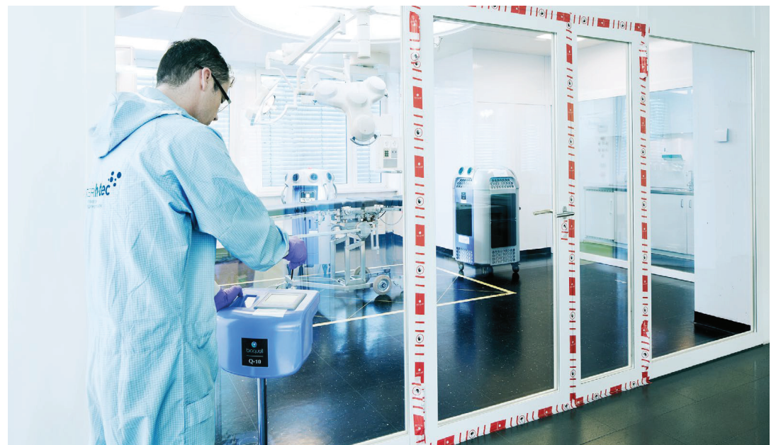
Dekontamination mit H_2O_2

Innerhalb von 24 Stunden nach der Erstkontaktaufnahme mit der Enzler Hygiene AG hat wieder alles im Normalbetrieb funktioniert – eine vorbildliche und effiziente Zusammenarbeit, die innert kürzester Zeit zum einwandfreien Ergebnis führte.