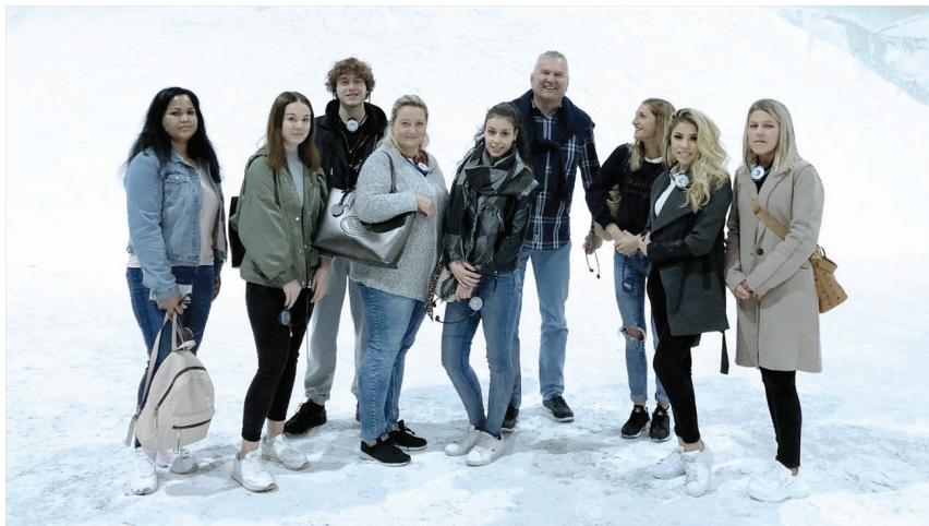
Enzler-Lernende mit Ihren Berufsbildnern beim jährlichen Ausflugstag

Die Enzler Gruppe war mit ihren Lehrlingen und Berufsbildnern der Salzgewinnung auf der Spur.