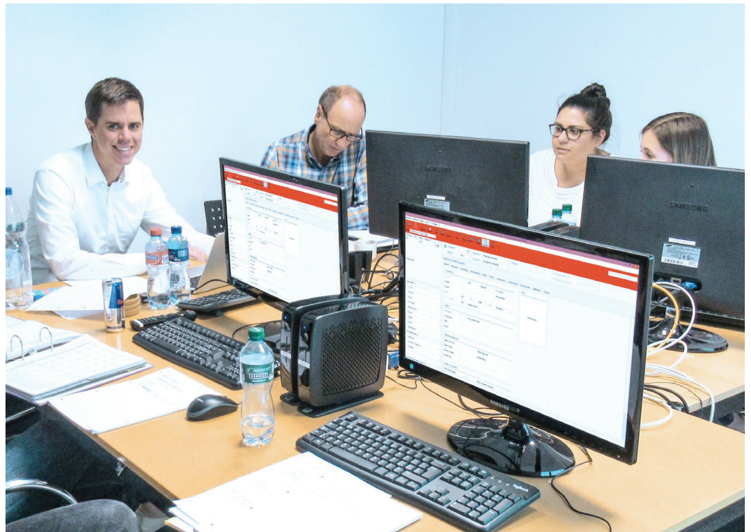
Aquarius-Workshop am Hauptsitz in Zürich

Mit dem neuen Leistungsumfang der IT-Lösung profitiert Enzler von einem einheitlichen Finanz- und Rechnungswesen für die gesamte Gruppe sowie von einem einheitlichen Personalmanagement und einer elektronischen Zeiterfassung. Zudem wird sicherge-