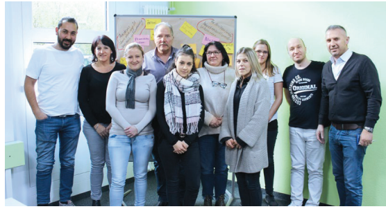
Enzler-Führungsverantwortliche im sfb Bildungszentrum, Dietikon

In den Führungskursen geht es vor allem um die Persönlichkeitsentwicklung. Die Teilnehmenden lernen, ihre persönliche Arbeitstechnik zu reflektieren und Strategien zu entwickeln, um mit Arbeitsstress