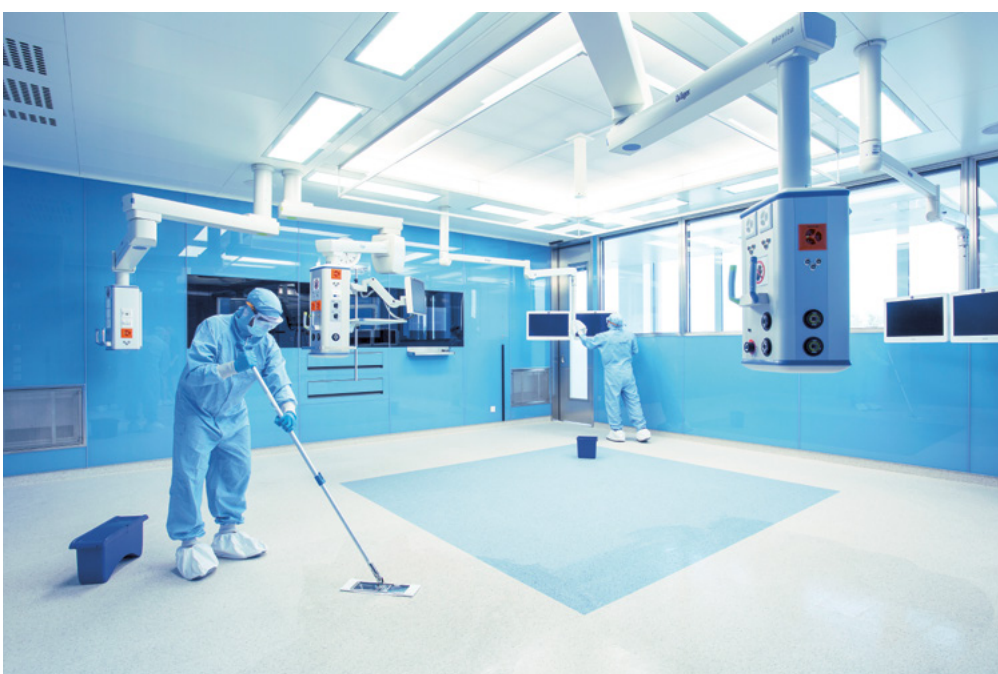
Beispiel eines Schutzgrad-OP-Saals mit quadratischem Luftauslass, Kantonsspital Münsterlingen

Die Enzler Hygiene AG hat grosse Erfahrung in der Kontaminationskontrolle von kontrollierten Räumen im Spital- und Pharmabereich. Zudem sind wir Ihre zertifizierte Partnerin für Hygiene-Inspektionen von Lüftungsanlagen nach SWKI VA104. Wir empfehlen Betreiberinnen und Betreibern, sich kritisch mit ihren Anlagen, den Regelwerken und deren Vorgaben zu befassen, damit sie ihre Prozesse und Anlagen optimieren können. Die Enzler Hygiene AG berät Sie gerne und unabhängig.