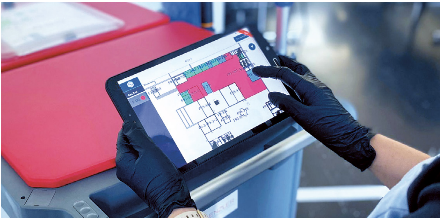
Digitaler Reinigungsplan im Einsatz bei Enzler

Gebäudeumbauten sowie Home- und Flexoffice sorgen dafür, dass die Reinigungsleistungen laufend angepasst werden müssen. Um auf die schnell ändernden Kundenanforderungen reagieren zu können, müssen die Reinigungsinformationen möglichst rasch an die Reinigungskräfte vor Ort übermittelt werden können. Zu diesem Zweck arbeitet Enzler mit verschiedenen Partnern an Lösungen zur digitalen und dynamischen Reinigungsplanung.