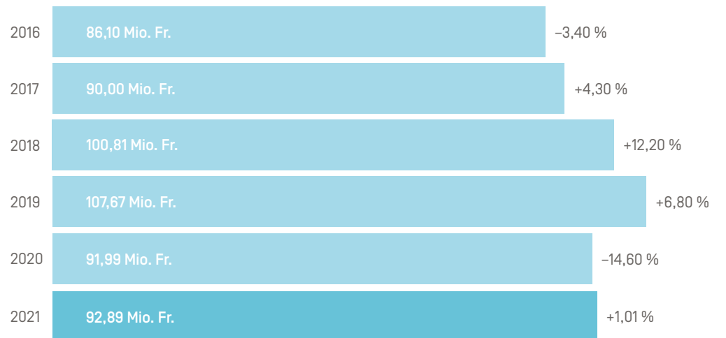
KONSOLIDIERTER UMSATZ 2016–2021

ein sehr anspruchsvolles Jahr 2021, in dem der Umsatz aufgrund von Verschiebungen von Aufträgen leider um über 10,7 % sank. Der Gruppenumsatz hat sich jedoch nur wenig verändert und ist um 1,01 % auf 92,89 Mio. Fr. angestiegen. Der rege Austausch mit unseren Kundinnen und Kunden hat uns motiviert, die Dienstleistungen den veränderten Marktanforderungen anzupassen und die angestossene Digitalisierung voranzutreiben. Wir sind sehr froh und dankbar, auf das Vertrauen unserer treuen Kundschaft zählen zu können. Unser Anspruch ist es, bedarfsgerechte Lösungen und Dienstleistungen in engem Kontakt mit unserer Kundschaft zu entwickeln und gemeinsam so zu nutzen, dass ein spürbarer Mehrwert entsteht.